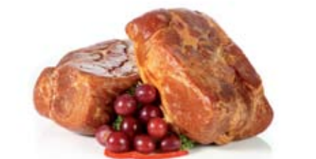
DIT LIMBURGS HAMPUNTJE IS NATUURLIJK GEZOUTEN EN GEROOKT