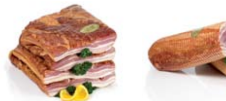
EEN OP AMBACHTELIJKE WIJZE DROOGGEZOUTEN MAGER SPEK