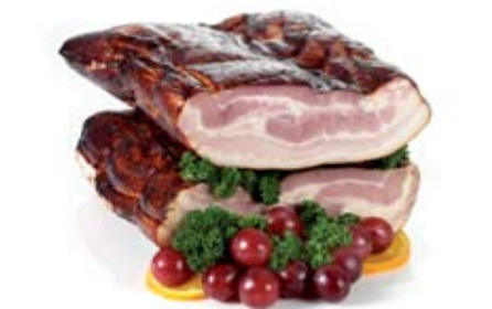
AMBACHTELIJK GEROOKT KATENSPEK