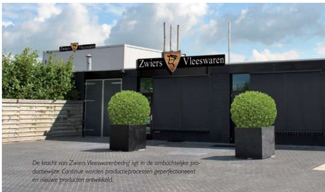
De kracht van Zwiers Vleeswarenbedrijf ligt in de ambachtelijke productiewijze. Continue worden productieprocessen geperfectioneerd en nieuwe producten ontwikkeld.

Klanten van Zwiers Vleeswaren uit Oss, kiezen voor tachtig jaar ervaring, vakmanschap, kwaliteit en originaliteit. De rauwe donker gerookte vleeswaren vormen onmiskenbaar de 'pijlers' onder het bedrijf. Dat deze producten voorzien zijn van een cognackleurtje geeft nog eens extra de puurheid aan.