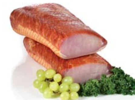
BRABANTSE BACON MET NET