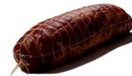
EEN OP AMBACHTELIJKE WIJZE DROOGGEZOUTEN RUNDERROOKVLEES, ZEER KARAKTERISTIEK VAN SMAAK