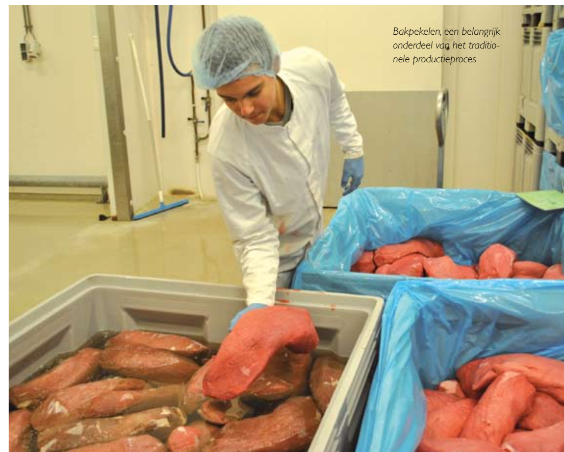
Bakpekelen, een belangrijk onderdeel van het traditionele productieproces